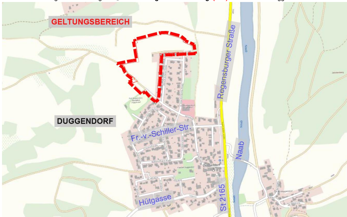
allgemeines Wohngebiet „An der Sandgrube 1. Änderung“ (neu) der Gemeinde Duggendorf

Der Geltungsbereich des Bebauungsplanes mit integriertem Grünordnungsplan „An der Sandgrube 1. Änderung“ umfasst den bereits bestehenden rechtskräftigen Bebauungsplan „An der Sandgrube“ und ist in seinen Ausmaßen mit diesem deckungsgleich.